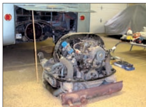
Dépose du moteur pour une réfection totale de l'embrayage.