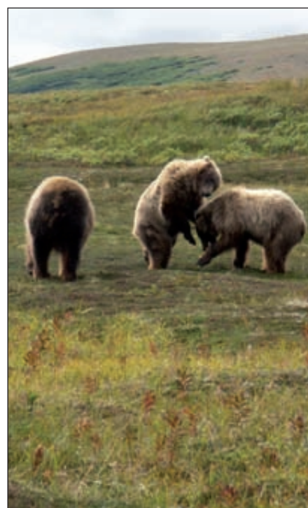
Ils ont l'air bien gentil ces nounours. Mais ce sont des grizzlis sauvages...