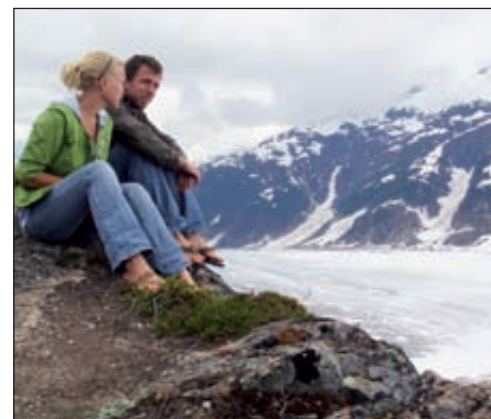
Petite pause face au Salmon Glacier, en Alaska.