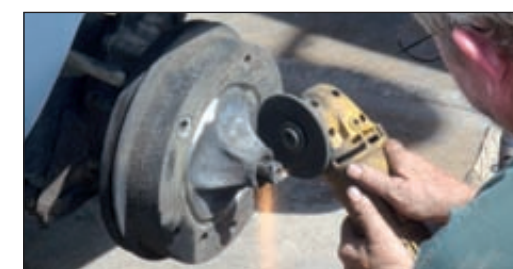
En désespoir de cause, il va carrément falloir découper le tambour...