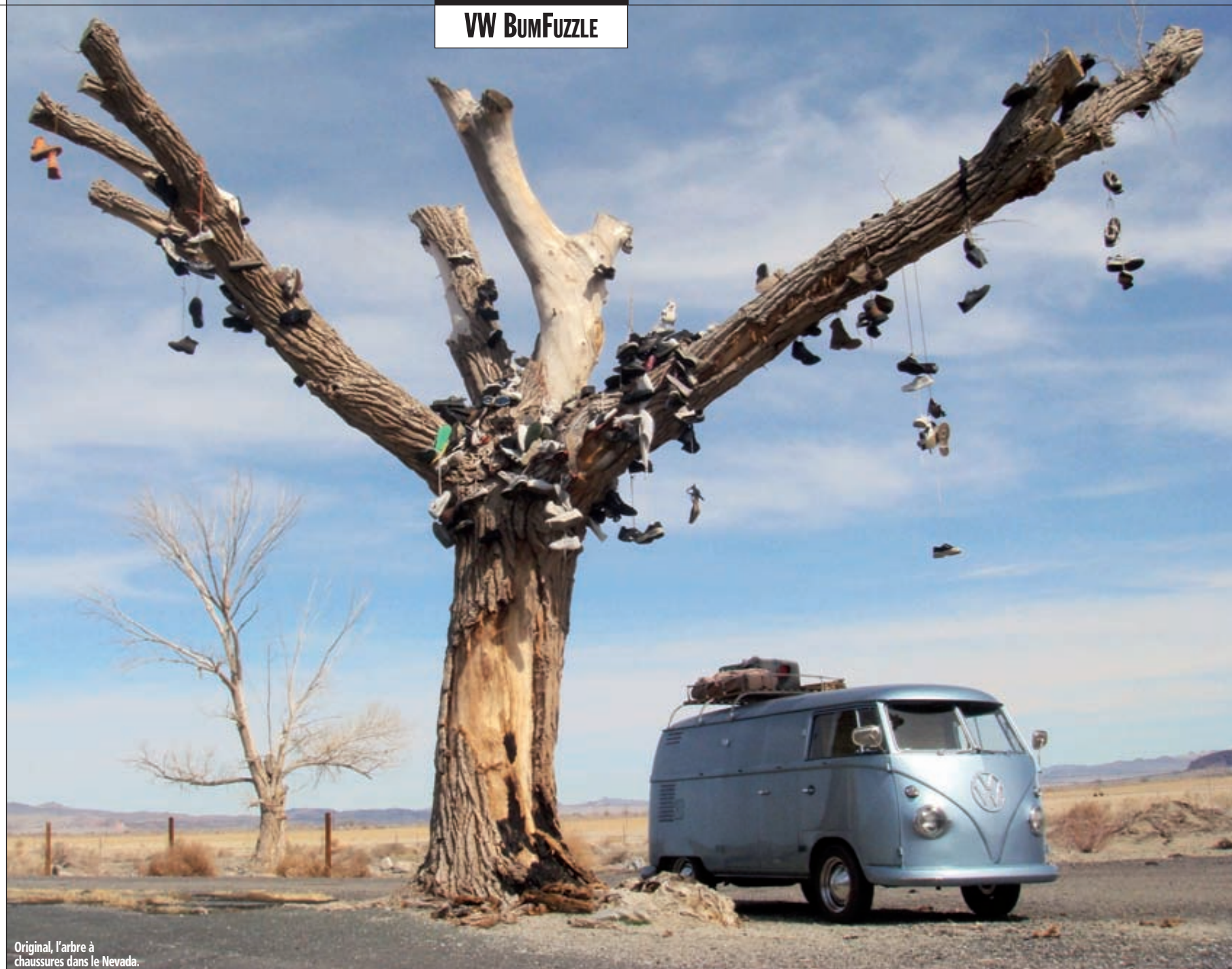
Original, l'arbre à chaussures dans le Nevada.

aériens que les autres, ne se gênent pas pour attaquer la face AV de Bumfuzzle. En une journée, les fenêtres safari sont marquées de deux impacts et la calandre métallique s'offre à jamais un bel éclat. La Cassiar Highway, ou route nationale 37, est sans aucun doute l'une des routes les plus grandioses de la planète, mais ses effets dévastateurs sur le petit Combi font parfois regretter les longues et droites autoroutes américaines. En fin de journée, Ali, pour une raison inconnue, décide de contrôler l'éclairage du Van. Est-ce son intuition féminine ? En tout cas, les feux AR ne fonctionnent plus, pas plus que les clignotants ou les stops. Secousses répétées de la piste, humidité... ? Patrick remet en fonction les feux AR. Pour le reste on verra plus tard. Miraculeusement, le lendemain matin, le clignotant droit revient à la vie. Pat pourra au moins indiquer aux énormes camions qu'ils peuvent dépasser sans crainte.