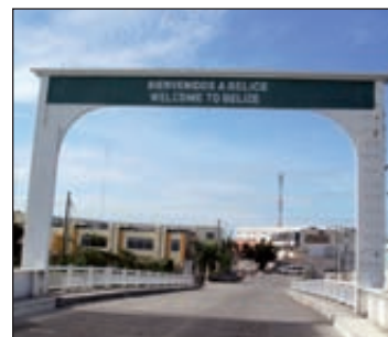
Bienvenue à Belize, l'un des plus petits pays d'Amérique centrale, coïncé entre le Mexique et le Guatemala.