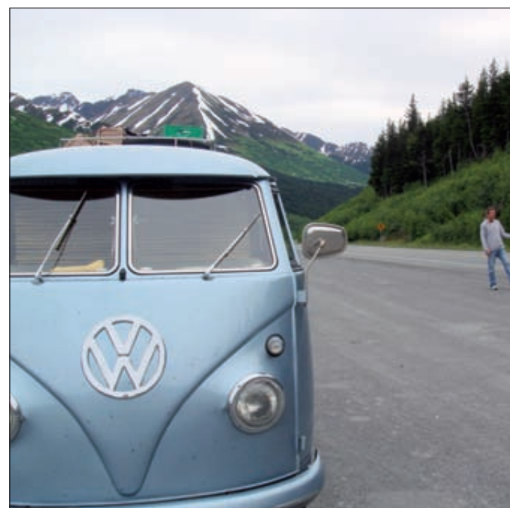
La panne d'essence devient récurrente. La prochaine fois, il faudra peut-être prévoir un plus gros bidon de secours...