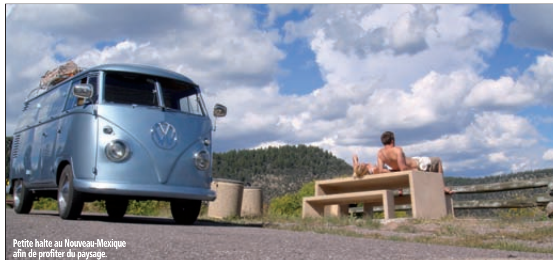
Petite halte au Nouveau-Mexique afin de profiter du paysage.

l'avaient prévu. Aussi, lorsqu'ils atteignent Anchorage, ils préfèrent se poser quelques jours pour partir à la recherche des... grizzlis ! Dans la région de Homer, à l'extrême sud-ouest de l'Alaska, les grands ours bruns se goinfrent, en cette saison, de saumons des rivières. Ils constituent ainsi leur graisse hivernale et sont l'attraction des touristes venus en hydravion les observer. C'est une grande expérience, même si Pat et Ali ont bien du mal à se plier aux règles imposées par ce type "d'excursion" en groupe, avec des voyageurs pressés. Le moral n'est pas au beau fixe. L'excécrable météo, cette humidité permanente... C'est décidé, la Russie, ce sera pour une autre fois. L'envoi du convoi par voie maritime demanderait six bonnes semaines, et ça les mènerait en plein hiver sibérien. Non merci, le besoin de soleil est trop fort. « Et si on allait au Panama ? » Aussitôt dit, aussitôt fait. Cap au sud, retour à Portland pour faire un