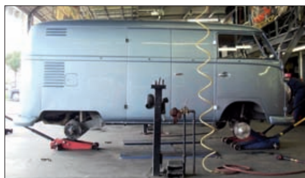
Bumfuzzle, papattes en l'air, pour un changement de pneumatiques.