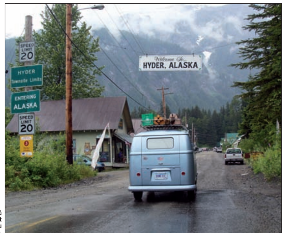
Arrivée à Hyder, le bout du monde, ou presque.