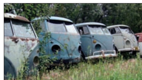
Au milieu de nulle part, une casse de Combi.