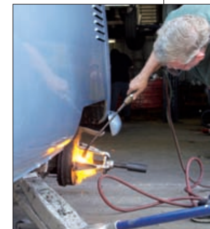
L'extracteur VW permettant normalement d'ôter les tambours sans problème ne suffit pas. Le chalumeau non plus !