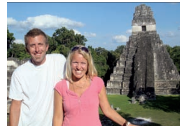
Les ruines Mayas de Tikal méritent le détour, et même si l'entrée coûte cher aux touristes, le lieu est magique.