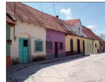
La petite ville de Flores, au Guatemala, avec ses maisons de couleurs.